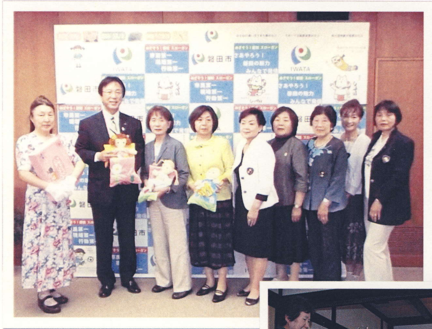
磐田市長 Iプラザ支援について お礼と会員との話合い