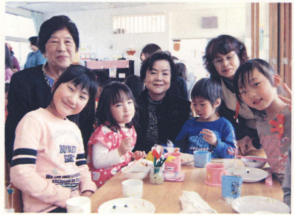
こうのとり東保育園 卒園を祝う会