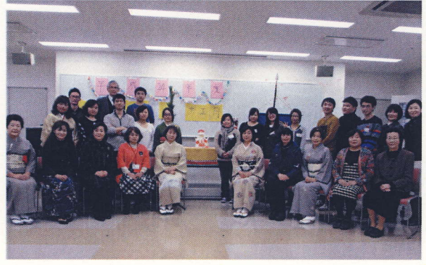
静岡産業大学交流会 ビバ！日本の正月