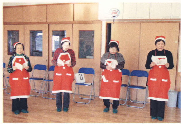
子供発達支援 いわしろ クリスマス会