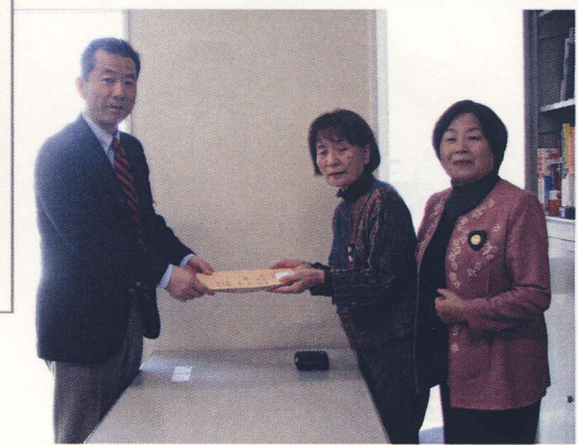
子宮頸がんワクチン無料化 署名、陳情書