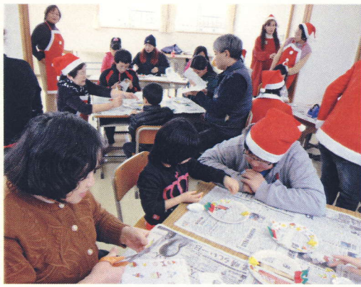
多文化交流センターこんにちは クリスマス会