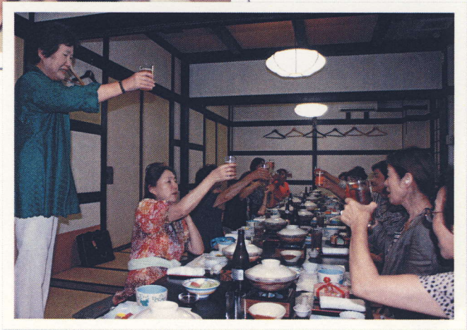
お疲れ様！ チャリティ慰労食事会