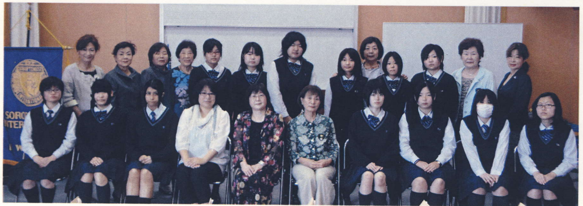
東海文化専門学校第3回Sクラブ入会式