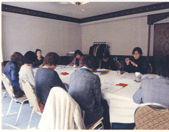
新入会員オリエンテーション